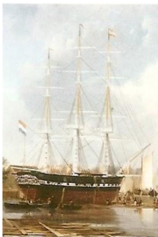
Het Fregat Generaal Baron van Geen